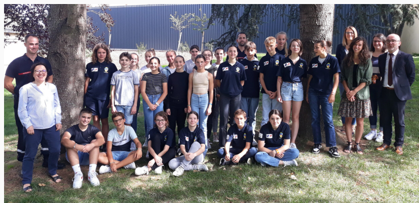
Cadets de l'Oriette, promotion 2022-2023